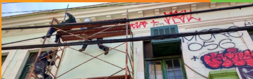
DETALLE DE LOS TRABAJOS REALIZADOS.